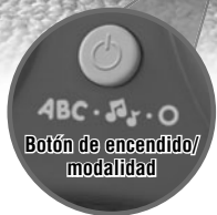
Botón de encendido/ modalidad