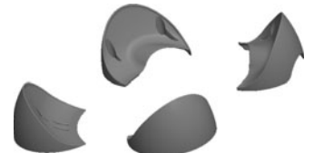
4 Bases 4 bases 4 bases