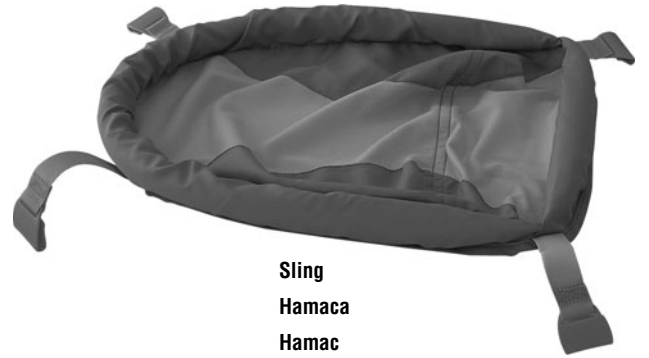
Sling Hamaca Hamac

Le produit non assemblé comprend de petits éléments détachables susceptibles d'être avalés. Doit être assemblé par un adulte.