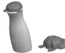
Toy Juguete Jouet