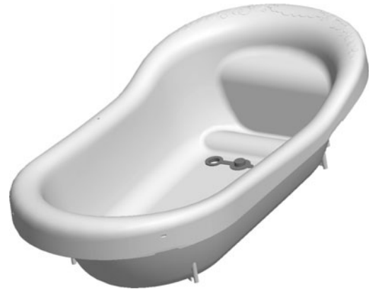
Bathtub Bañera Baignoire