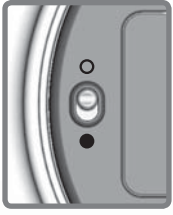
POWER SWITCH INTERRUPTOR DE ENCENDIDO INTERRUPTEUR